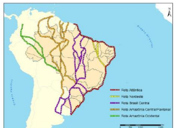
Mapas das principais rotas de aves migratórias nas Américas e no Brasil.